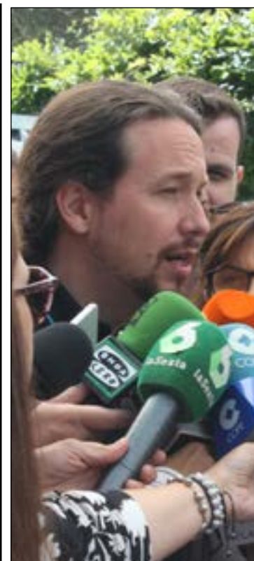
Iglesias atiende a los medios después de votar.

En lo referente a la participación en los comicios de Galapagar, este año ha habido un porcentaje muy similar al que se registró hace cuatro años en las últimas elecciones. Un 66,28% de los ciudadanos acudió a los centros electorales para escoger al próximo alcalde del municipio. Galapagar también fue el foco de atención de los medios nacionales durante la jornada electoral por el voto de Pablo Iglesias e Irene Montero, de Unidas Podemos, en el Colegio La Navata sobre mediodía.