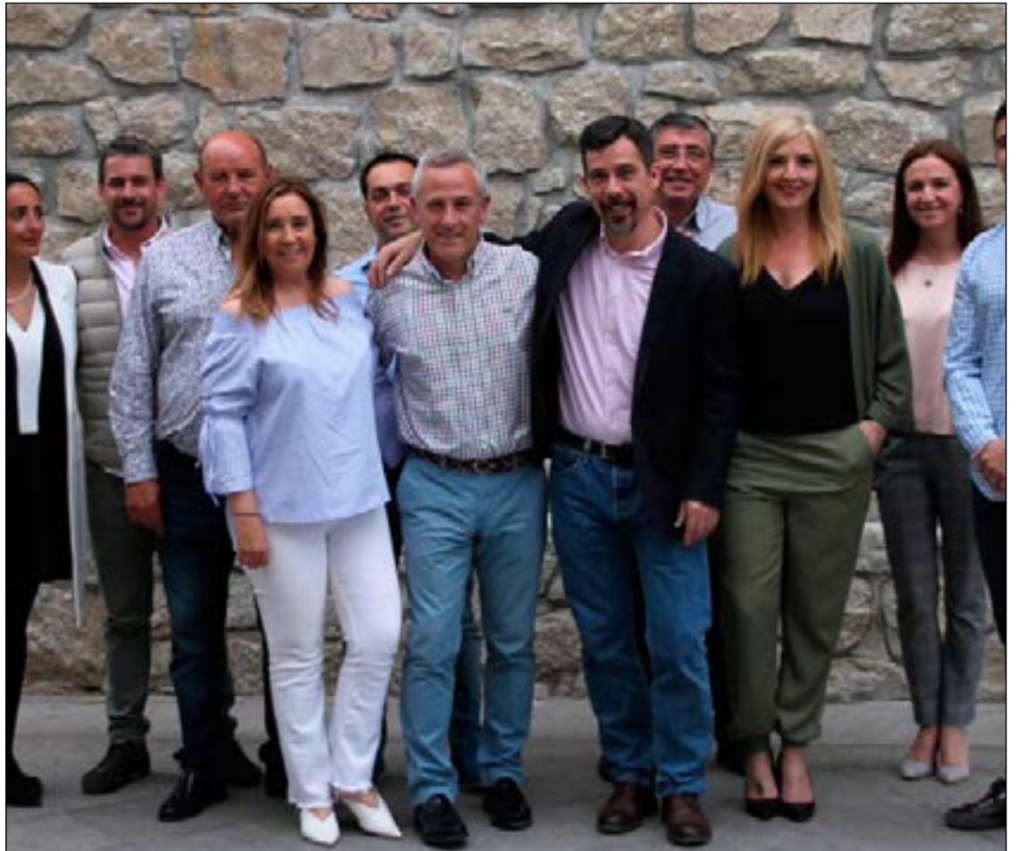
El Alcalde Ramón Regueiras junto a su equipo de Gobierno.