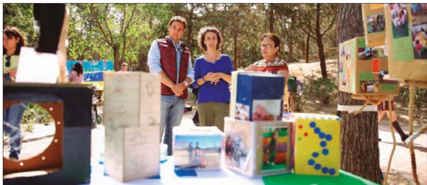
De la Uz entrega la bandera verde del proyecto Ecoescuelas.