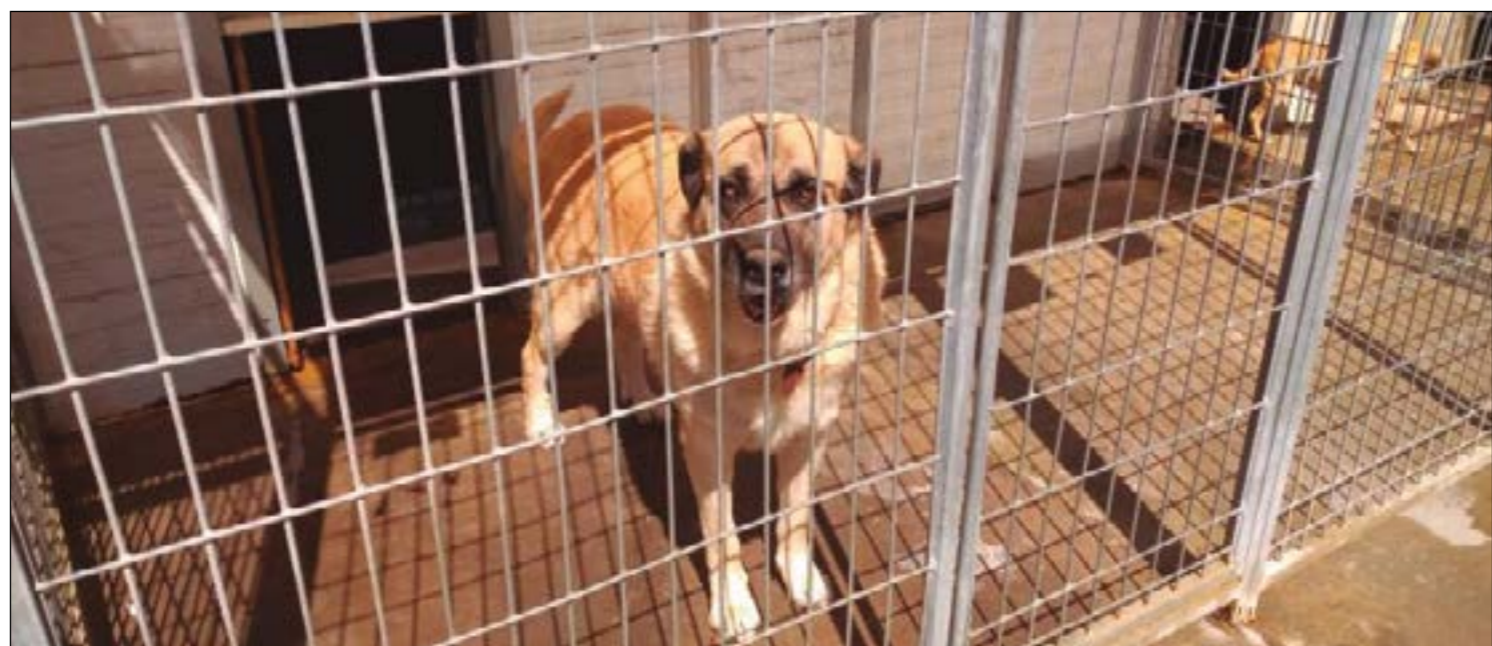
El Centro de Acogida Animal de Guadarrama se encuentra saturado.