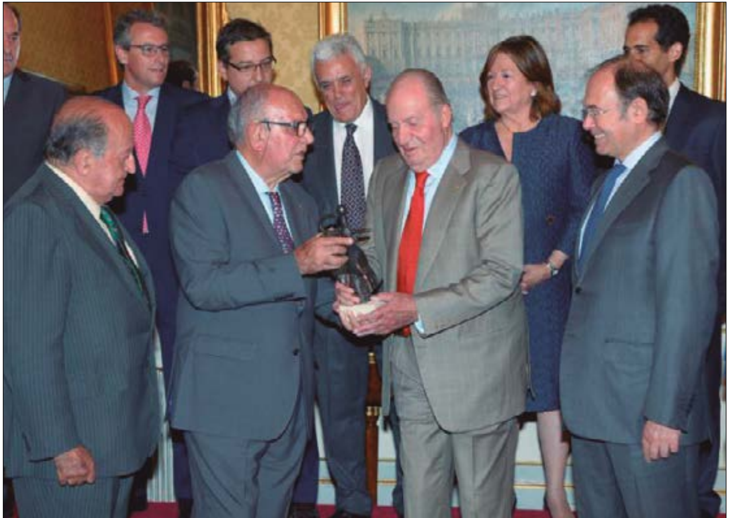
El Rey Emérito Juan Carlos I recibe el Premio Extraordinario, "escultura en bronce de Gabriel de la Casa".

De media, 18.865 personas llenaron los tendidos de Las Ventas, un promedio del 80%. Con un grueso de facturación de 23 millones de euros por temporada. ¿Y con estos datos quién se atreve a decir que la fiesta está en decadencia? Hasta los espectadores de toros de TeleMadrid crecieron en audiencia. La corrida goyesca del 2 de Mayo sumó un 8% de audiencia, mientras que el festejo del 15 de Mayo, Día de San Isidro, alcanzó el 10%. Estas cifras se sitúan muy por encima de la audiencia del canal media, que el pasado mes de marzo alcanzó un 4% de cuota de pantalla media. Y ni que decir que hasta el ministro en funciones socialista José Luis Ábalos envió una carta al torero Román agradeciéndole el brindis e indicando "He cultivado siempre un aprecio sincero por la Fiesta". ¿Será que ahora que está en el poder empieza a verlo más claro? En cualquier caso lo que sí está claro es que la Fiesta crece y mucho.