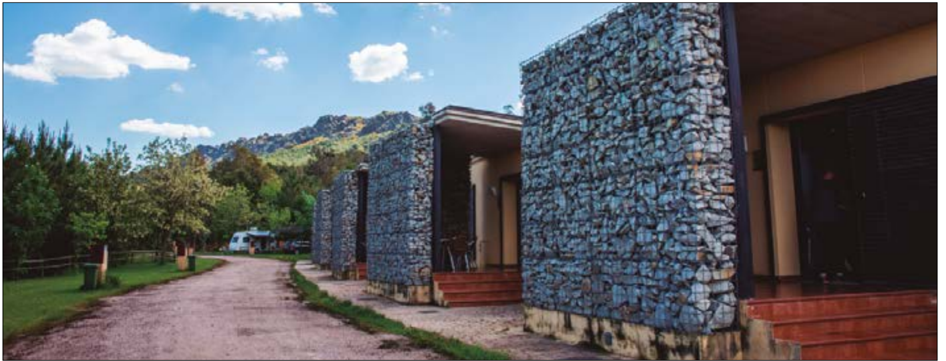
TURNAT en su constante emprendimiento turístico, abre estas magníficas instalaciones en un lugar único lleno de extraordinaria belleza y magia en plena Reserva Mundial de la Biosfera